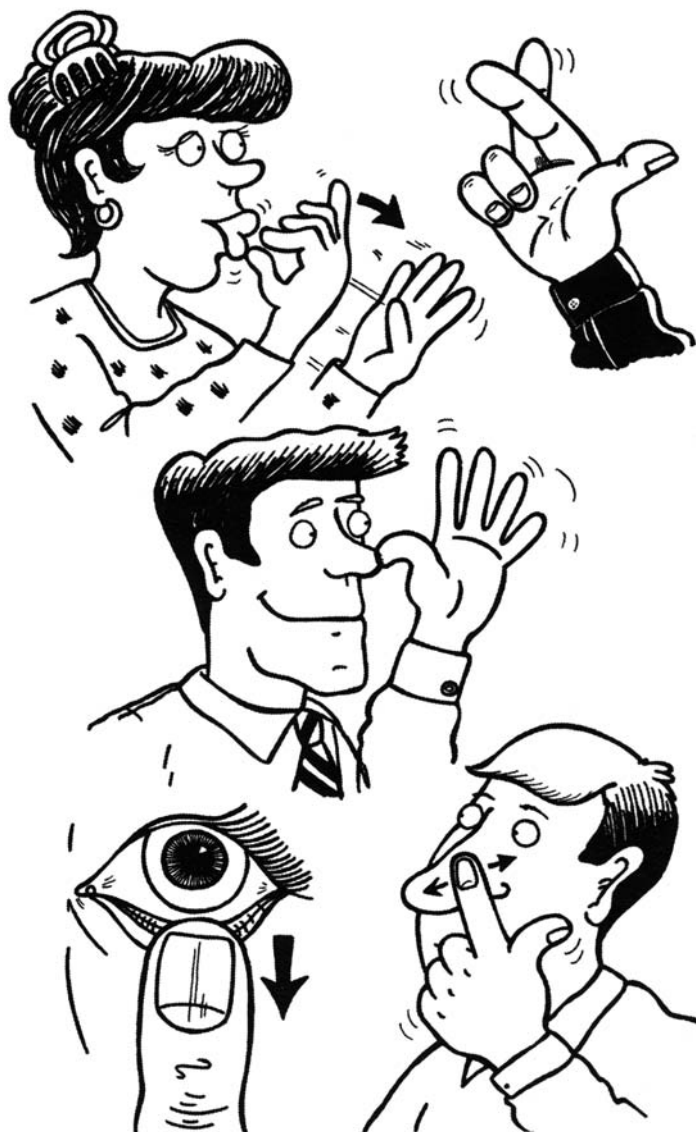
Rysunek 4.1. Niektóre popularne gesty

Skrzyżowanie palców , czyli splecenie palca wskazującego i środkowego i umieszczenie pozostałych palców pod kciukiem, może